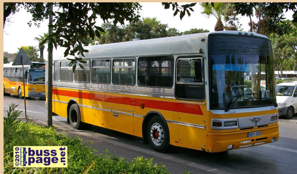
21.11.10 – Valletta

Samme buss som på forrige bilde, nå på vei ut fra Valletta Bus Terminus.