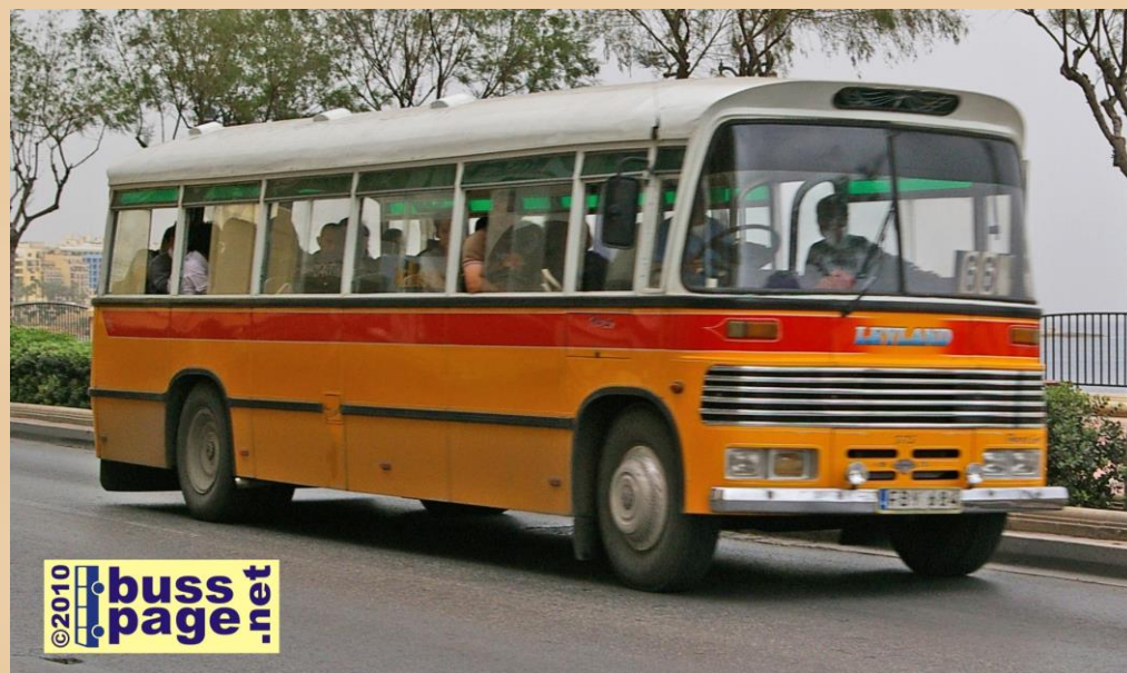
01.12.10 – Surfside, Sliema

På en av turene vi var med ramlet forresten en barnevogn ut av bussen i en rundkjøring – men heldigvis var den tom. En helt udramatisk hendelse så det ut som, og ingen som reagerte - annet enn at en passasjer spratt opp og hentet vogna inn igjen da sjåføren hadde stoppet. Her til lands hadde dette sikkert medført store oppslag i diverse aviser. . .