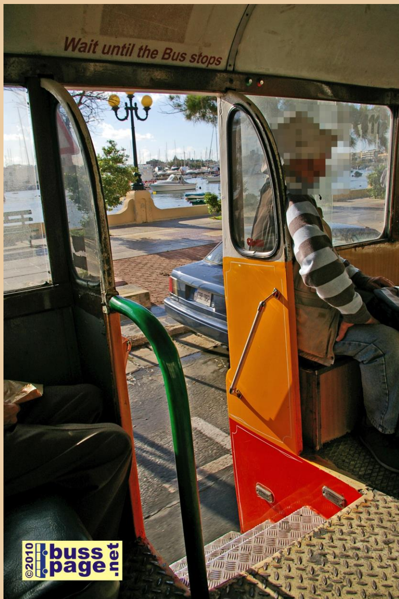
24.11.10 – Sliema