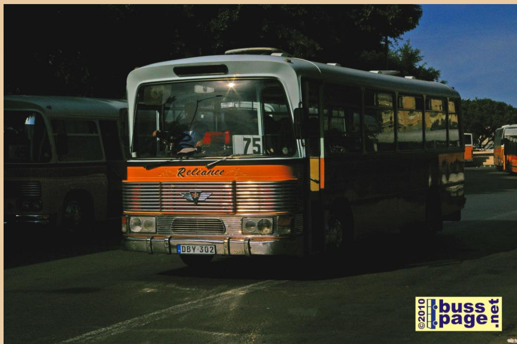
21.11.10 – Valletta