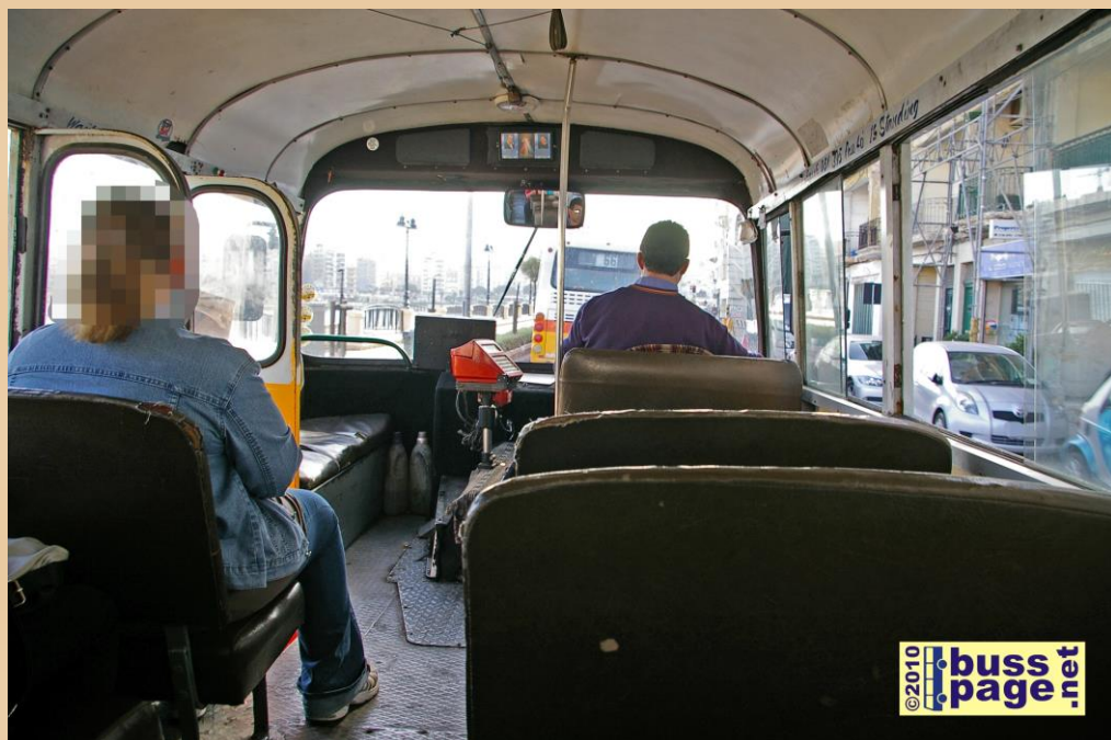
29.11.10 – St. Julians