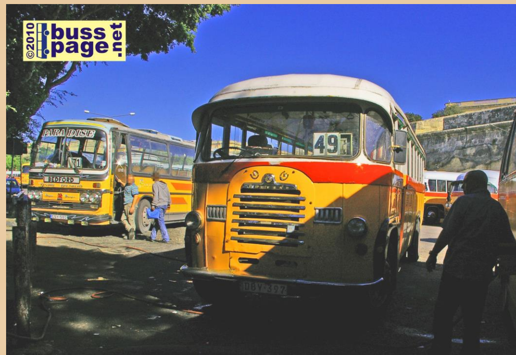
22.11.10 – Valletta

Inne i samme bussen som på de to forrige bildene, på vei til Valletta.