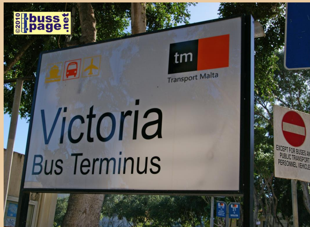
27.11.10 – Gozo – Victoria

Her er ett annen eksempel på en informasjonstavle. Denne står på holdeplassen ved Ta' Qali Crafts Village.