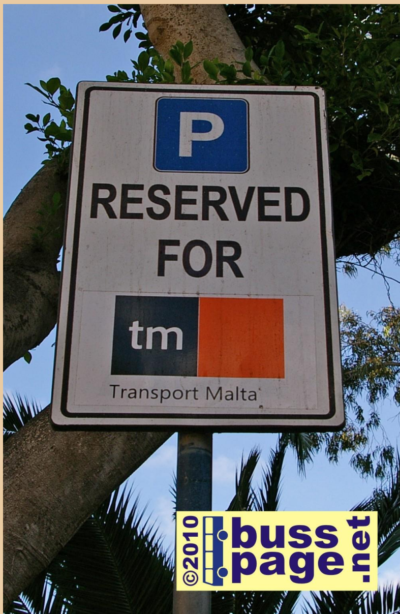
27.11.10 – Gozo – Victoria