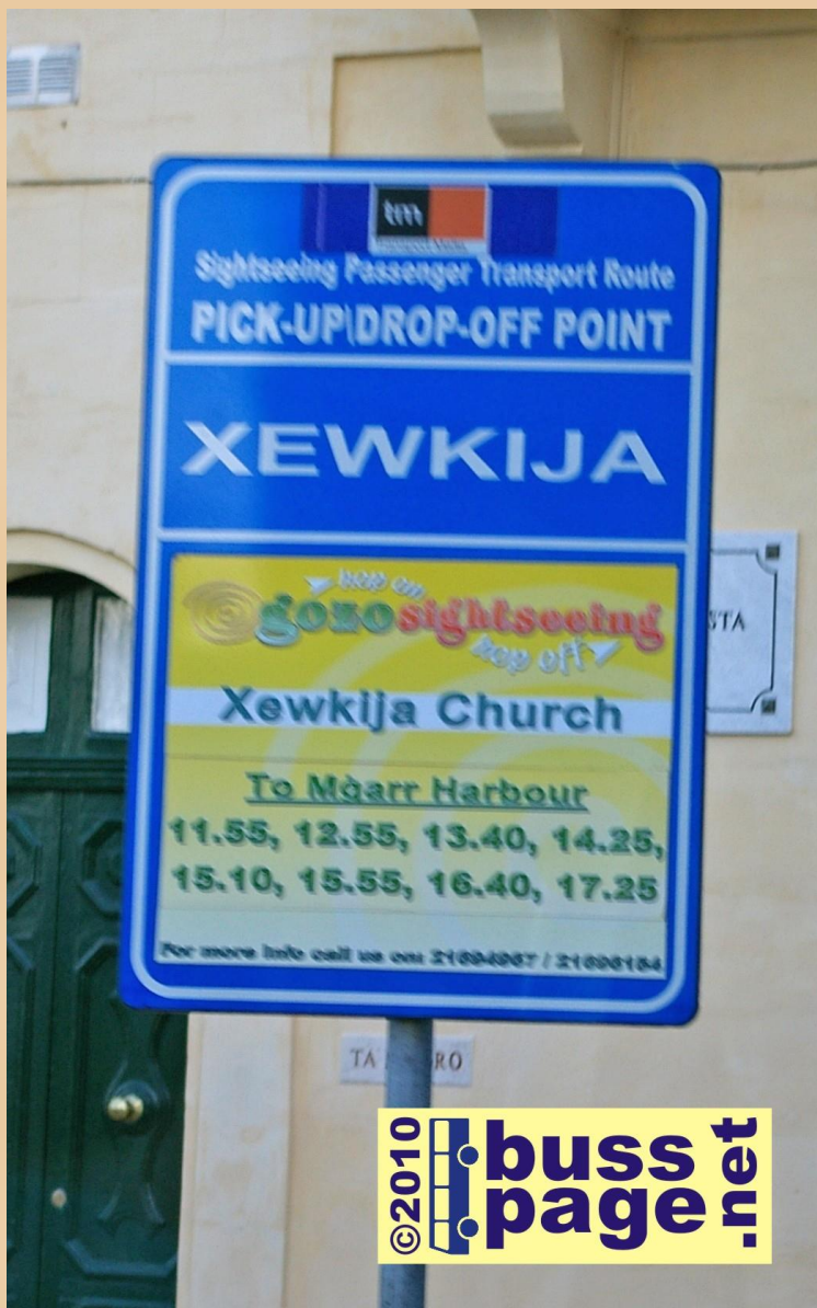
27.11.10 – Gozo – Xewkija Her er sightseeing holdeplassen i Xewkija.