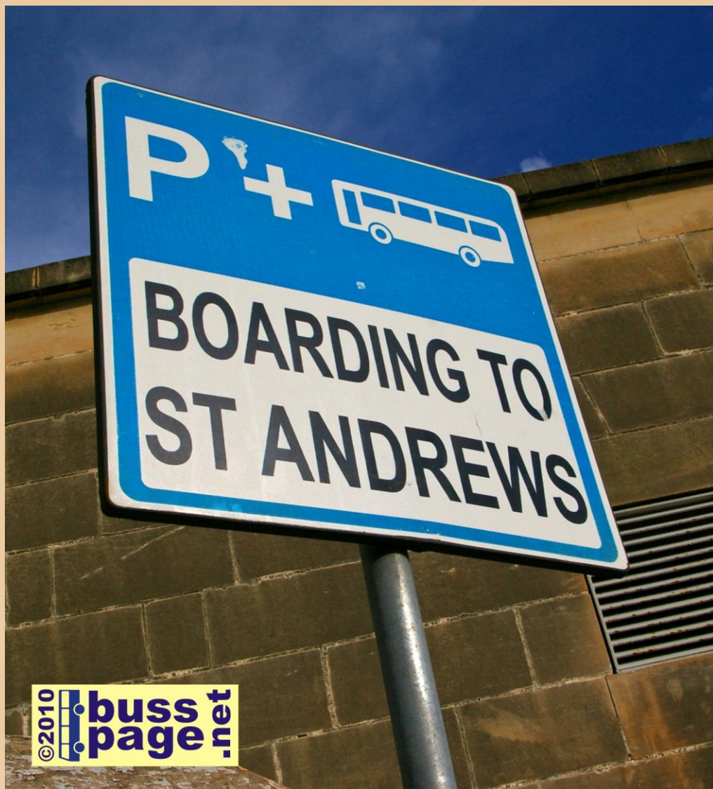
25.11.10 – St. Julians