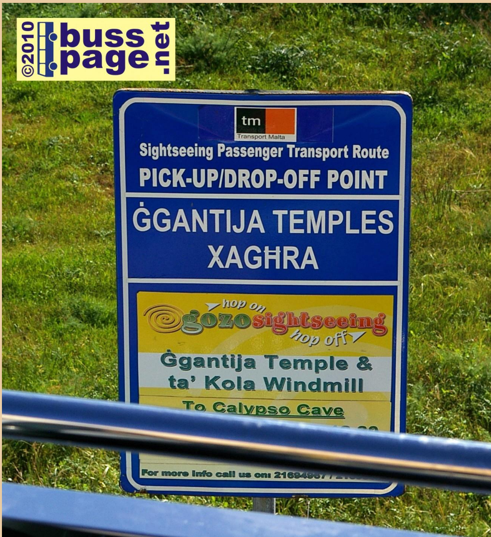
27.11.10 – Gozo – Xagħra