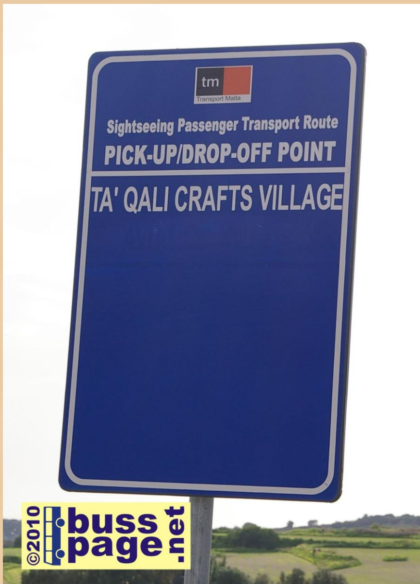
02.12.10 – Ta' Qali