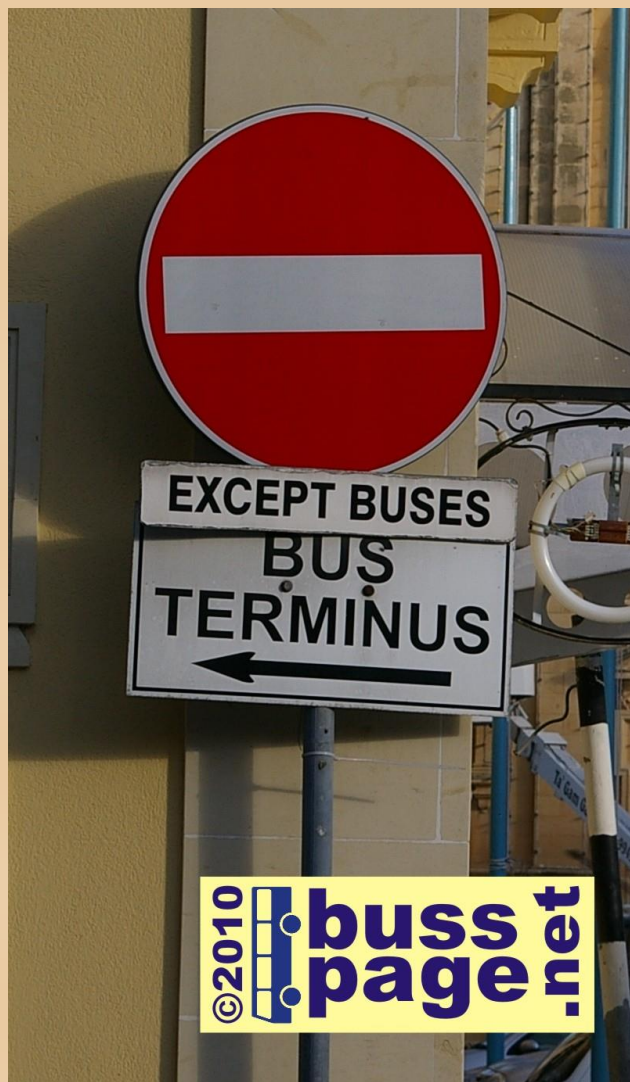
27.11.10 – Gozo – Victoria