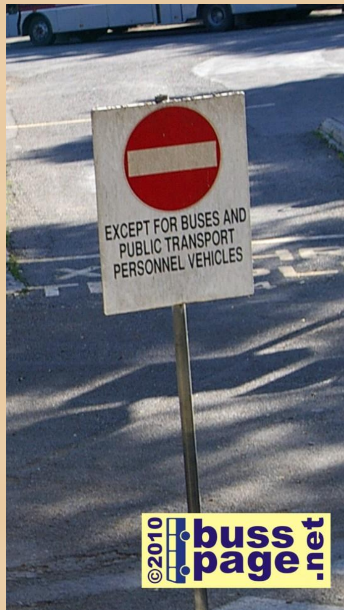
27.11.10 – Gozo – Victoria

En del av Triq Putirjal i Victoria er enveiskjørt. Men selv om den er det, så kan allikevel busser kjøre imot kjøreretningen for å komme seg ned til Bus Terminusen. Det hører med til dette, at gaten er ikke bredere enn det en buss er. Så kommer det noen imot, må de rygge for at bussen skal kunne komme fram.