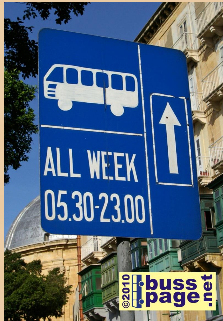
29.11.10 – Valletta Informasjonsskilt for kollektivfelt i Triq Sarria i Floriana, på veien inn mot Valletta Bus Terminus.