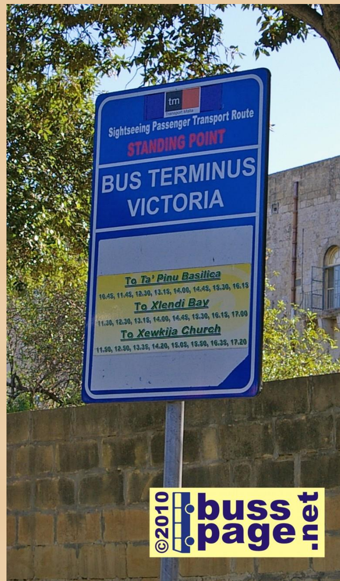
27.11.10 – Gozo – Victoria

Holdeplassen ved Ta' Qali Crafts Village, som ligger rett ved Mdina og Rabat.