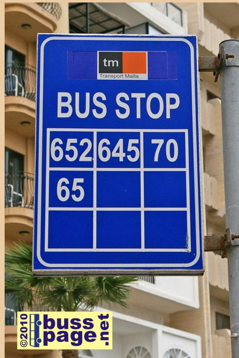
01.12.10 – Sliema

Fra en holdeplass i Sliema, som også betjenes av vanlige rutebusser. Her er det rute 62, 64, 67, 68 og 671 som stopper. Ingen av disse rutene er ekspress- eller direkteruter.