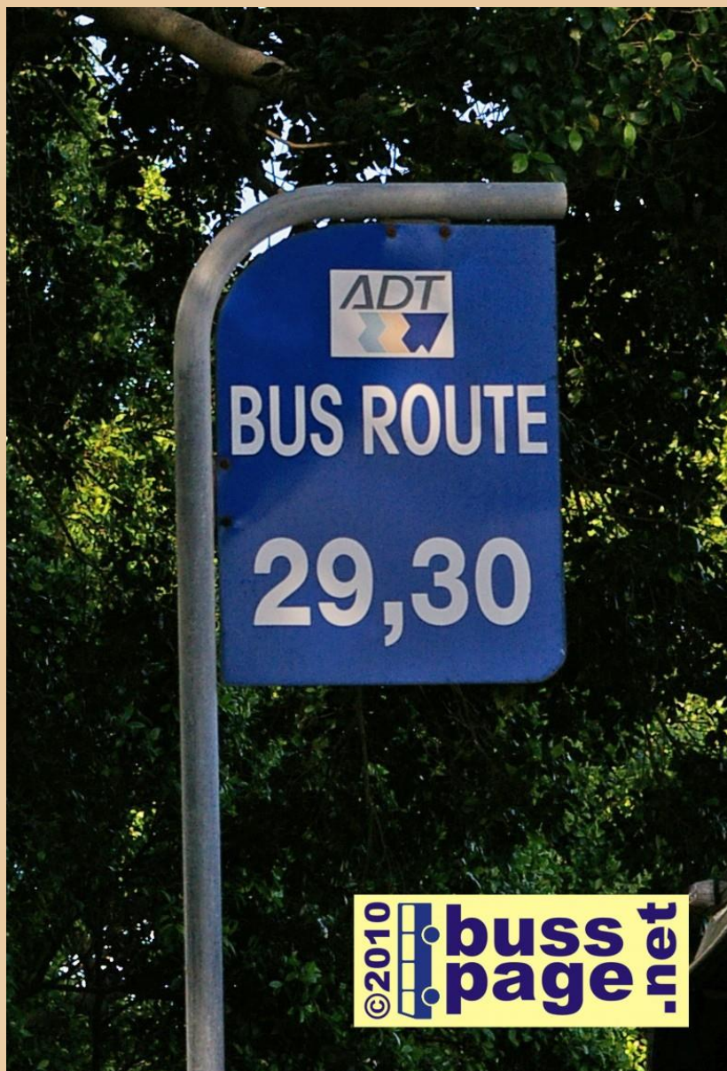
21.11.10 – Valletta