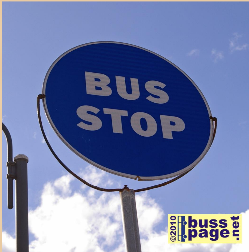
23.11.10 – Paceville