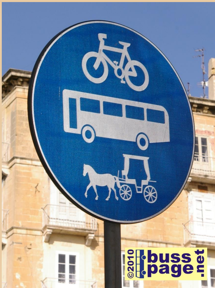
29.11.10 – Valletta