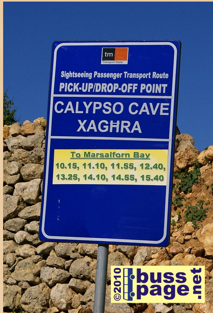
27.11.10 – Gozo – Xagħra

Fra Xagħra, der man kan ta en titt på Ġgantija Temples.