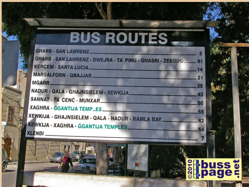
27.11.10 – Gozo – Victoria