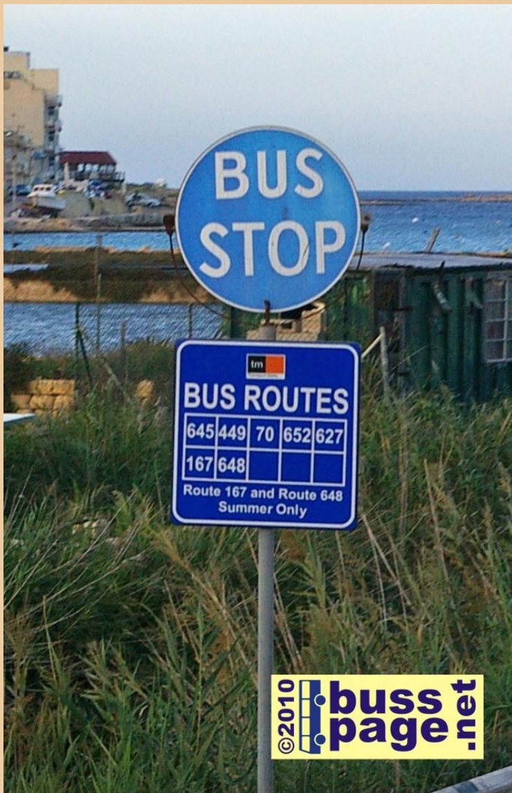
21.11.10 – Qawra