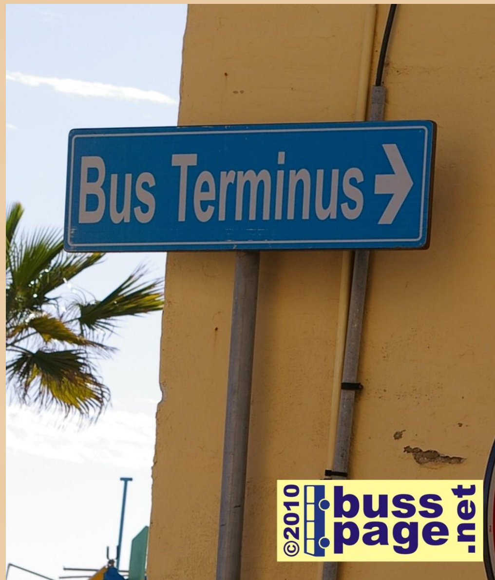
26.11.10 – Marsaxlokk

Et «park and ride»-skilt ved St. Julians Bus Terminus for passasjerer som skal nordover i retning mot St. Andrews.