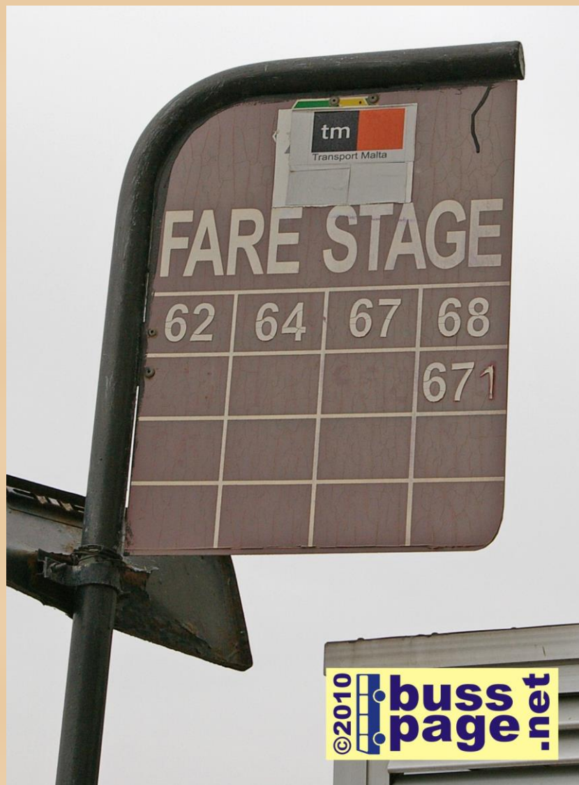
01.12.10 – Sliema