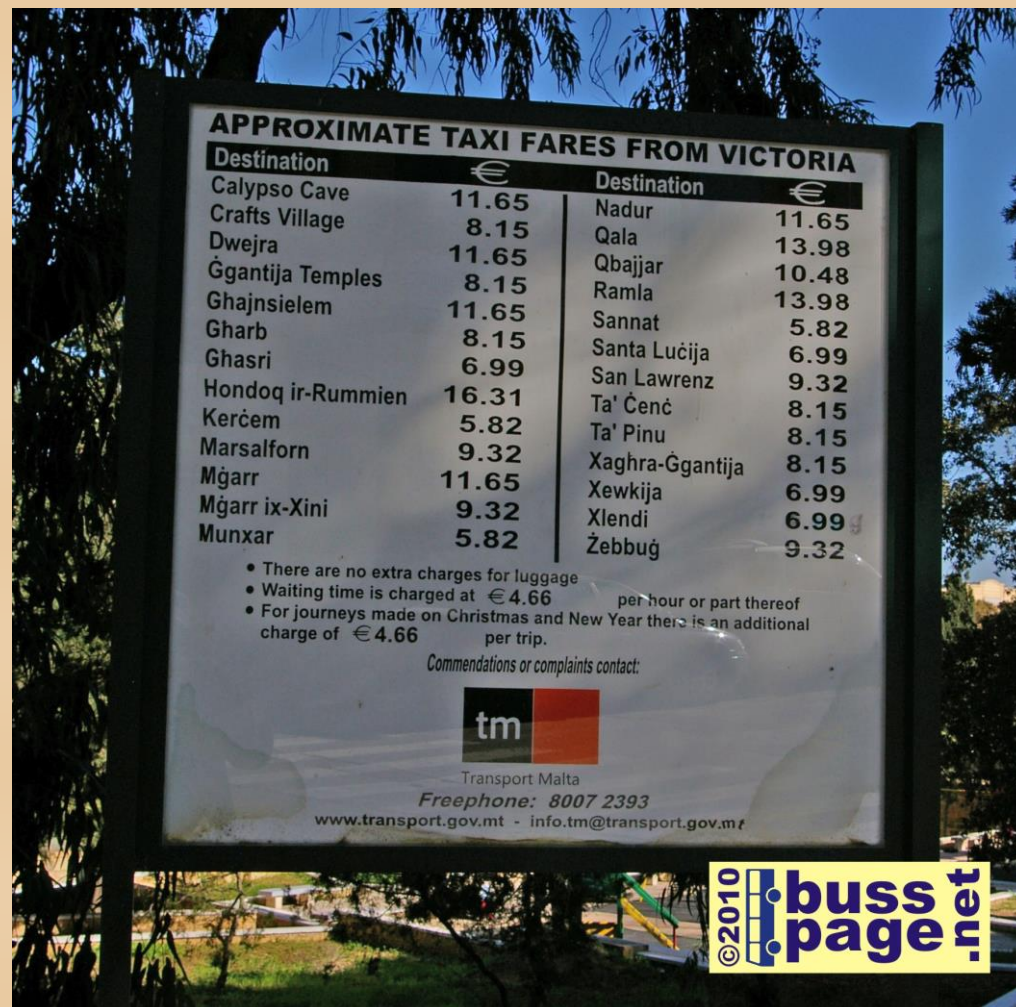
27.11.10 – Gozo – Victoria

Informasjonstavle over alle bussrutene på Gozo ved Victoria Bus Terminus.