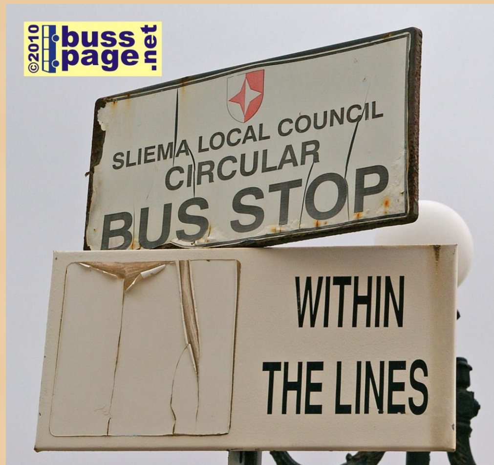
01.12.10 – Sliema

Inne på Valletta Bus Terminus er sporene til rutene skiltet som dette.