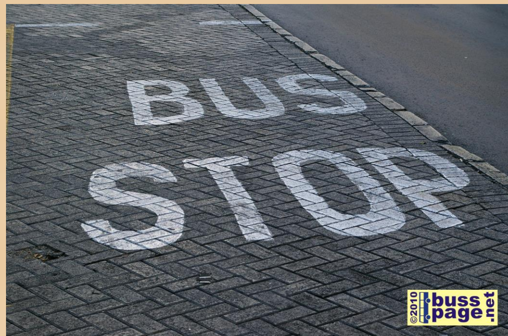
23.11.10 – St, Julians