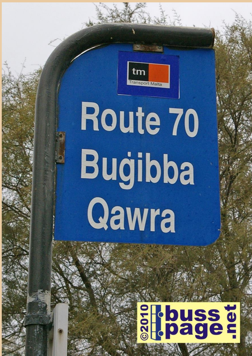
01.12.10 – Sliema

Dette er fra Sliema Bus Terminus og sporet til rute 70.