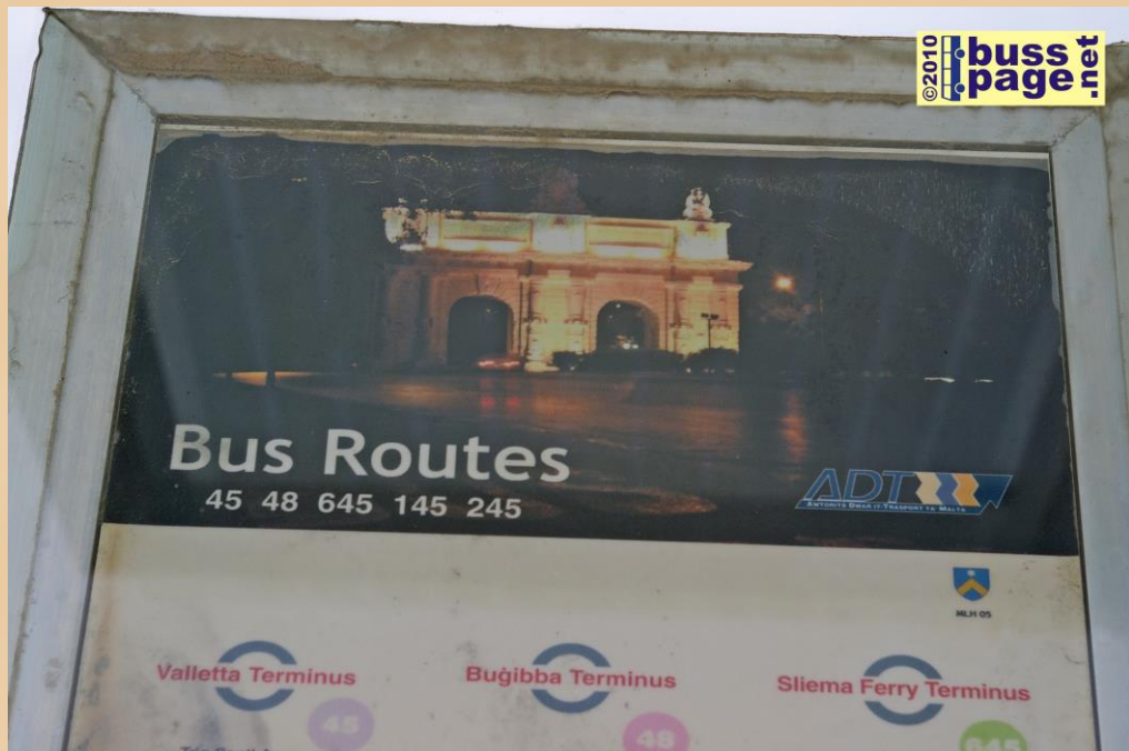
30.11.10 – Għadira MT-114-2-018 På noen holdeplasser var det en slik informasjonstavle som forteller rutetidene til de bussene som passerer holdeplassen. Denne står på busskuret til holdeplassen i Għadira i Mellieħa Bay.