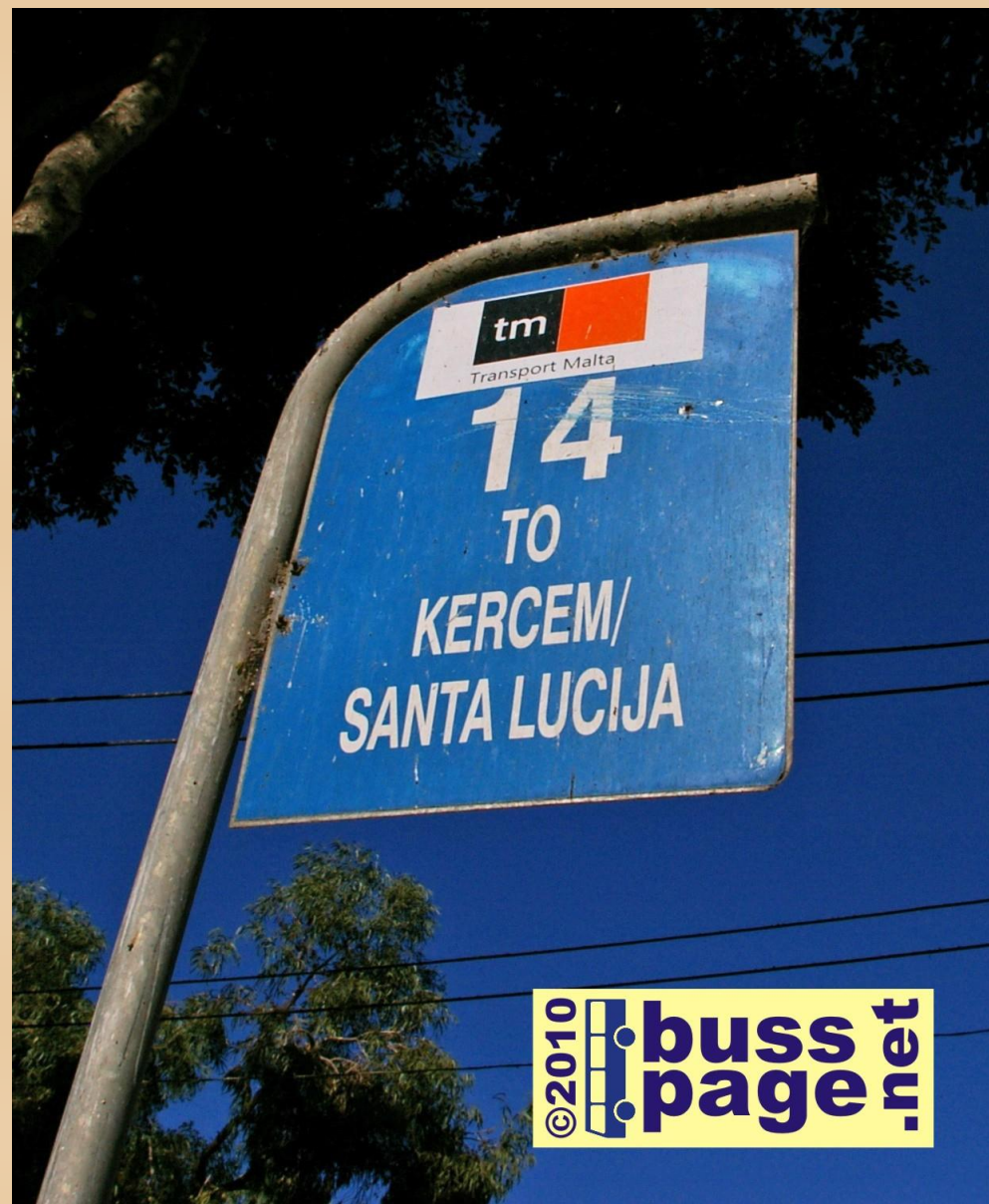
27.11.10 – Gozo – Victoria

Utenfor kontoret til TM i Victoria har de reservert en parkering til egen bil.