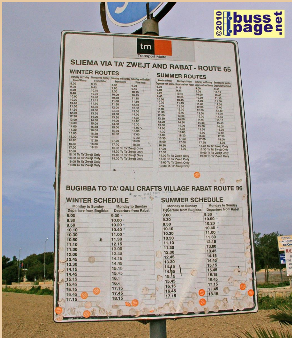
02.12.10 – Ta' Qali