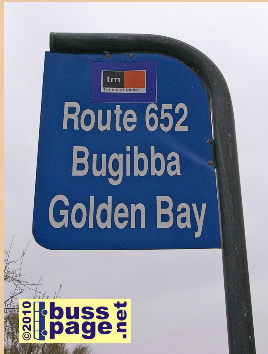
01.12.10 – Sliema

Fra Sliema Bus Terminus og sporet til rute 652.