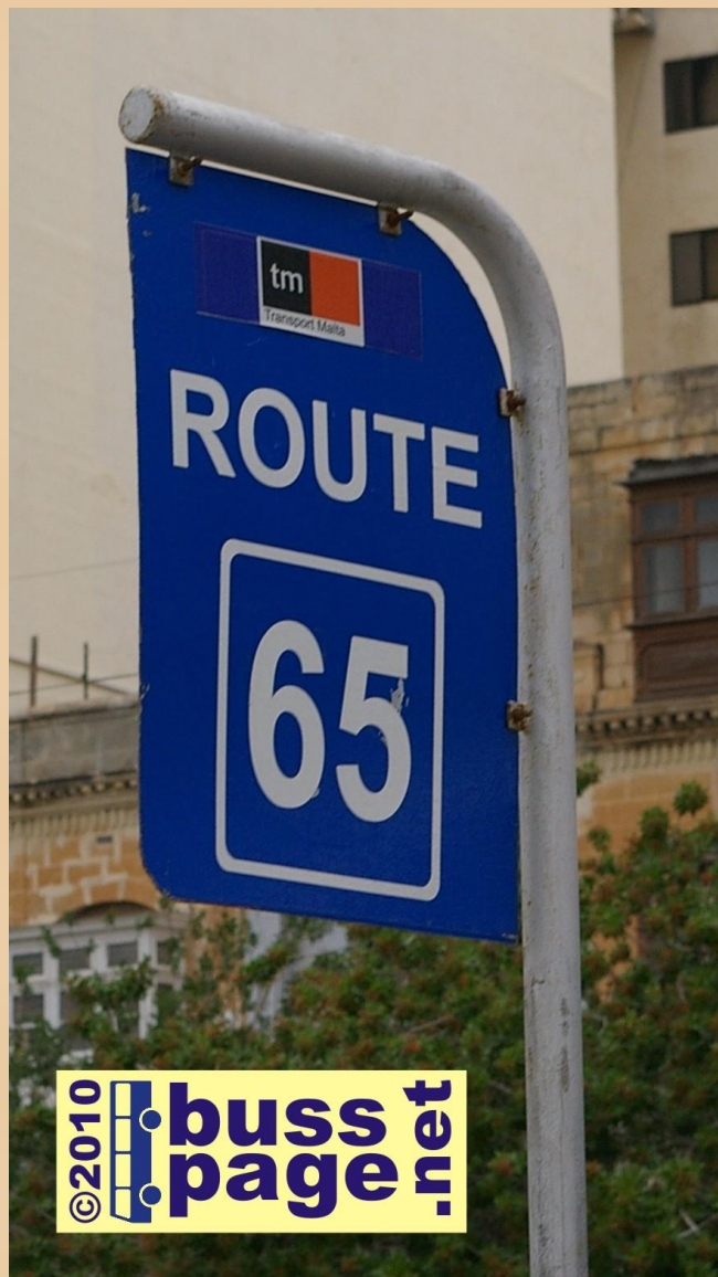
01.12.10 – Sliema Fra Sliema Bus Terminus og sporet til rute 65.