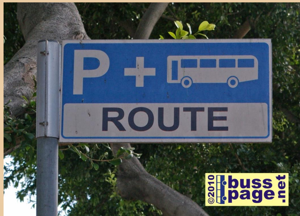
21.11.10 – Valletta

Kollektivfelt for sykler, busser og karozzini i Triq Nazzjonali i Floriana, opp mot Valletta Bus Terminus.